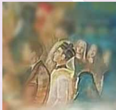
Don Benedetto raffigurato nel quadro di Goffredo Razzicchia posto dietro l'altare della chiesa

Bar Centrale CAFFETTERIA Frattocchie - MARINO (RM) Via Nettunense Vecchia, 7 - Tel. 328.6162316