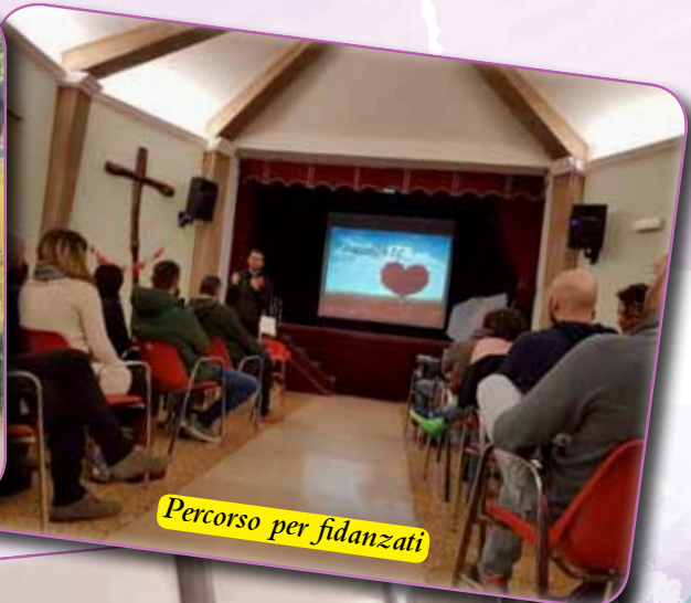
Percorso per fidanzati