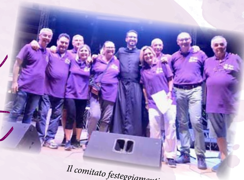
Il comitato festeggiamenti